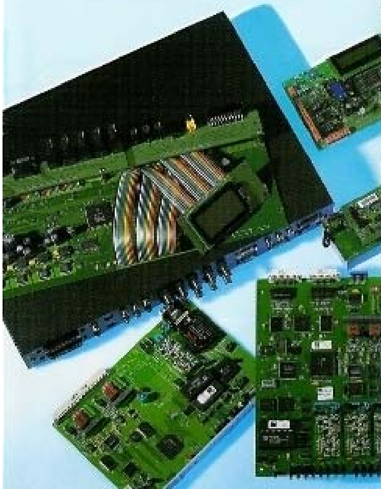
Imagem: 12/17 - Aquino/2012